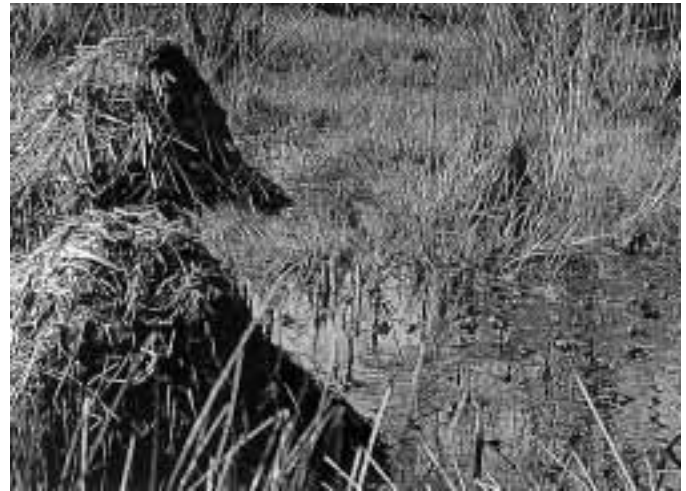
2b Flachwasserbereich am Ufer mit Rutgesellschaften von Rana arvalis

Laichgewässer im Spätsommer zeitweilig aus, kann dies von Vorteil sein, da sich auf diese Weise das Prädatorenspektrum reduziert. Ein zu frühes Austrocknen jedoch, schon in den Monaten Mai bis Juli, vernichtet oft auch den Nachwuchs der Amphibienpopulationen.