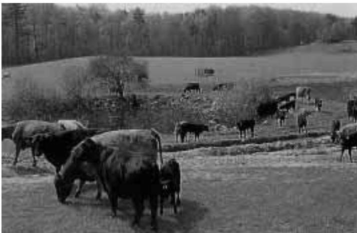
Abb. 5 Einzelgewässer werden oft zu beliebten Viehtränken und verlieren auf diese Weise ihre Habitatfunktion binnen kürzester Zeit.

Die meisten einheimischen Amphibienarten werden in den Roten Listen des Bundes und der Länder geführt. Arten, wie Rotbauchunke, Laubfrosch und Kammmolch sind vom Aussterben bedroht bzw. stark gefährdet (z. B. ANDREN et al. 1986). Ihrem Schutz wurde daher europaweit ein besonderer Stellenwert eingeräumt (Flora-Fauna-Habitat-Richtlinie [FFH], Berner Konvention, CORBETT 1989), ohne daß sich dies jedoch bislang vor Ort niederschlägt. Insbesondere die FFH-Richtlinie (offiziell: Richtlinie 1992/43 EWG des Rates zur Erhaltung der natürlichen Lebensräume sowie wildlebenden Tiere und Pflanzen) wäre ein geeignetes Instrument, um zumindest in naturräumlich hochwertigen Agrarlandschaften eine angepaßte und