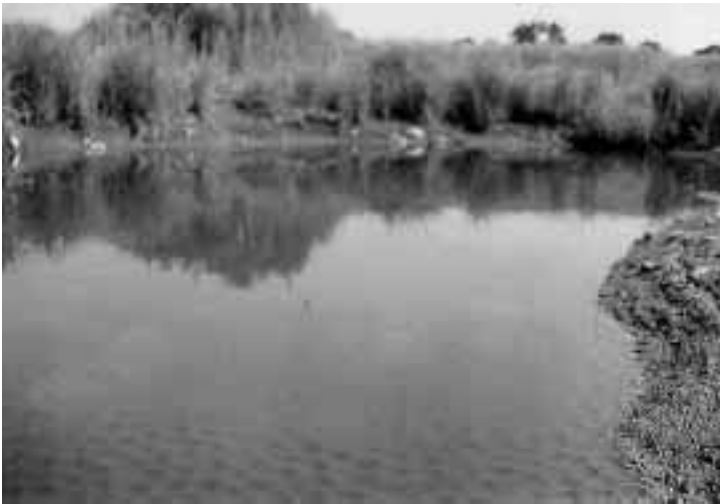
Abb. 4 Wechselkröten bevorzugen vegetationsarme Kleingewässer als Laichplätze. Die Larven halten sich in kleinen Absenktrichtern am Grund auf.

99%igen Rückgang der Individuenzahlen bei Amphibien innerhalb von 20 Jahren.