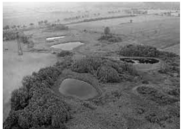
Abb. 3 Kleingewässer bei Blumberg - Saumtyp

Das Vorhandensein geeigneter Laichgewässer ist der verteilungsbestimmende Faktor selbst für ubiquitäre Arten (z.B. Teichmolch, Teichfrosch, Knoblauchkröte). Laichplätze sind daher die am wenigsten belastbaren Teilebensräume von Amphibienpopulationen (BLAB 1986). Der katastrophale Bestandsrückgang der Amphibienfauna in Mitteleuropa (HONEGGER 1981, HENLE u. STREIT 1990) spiegelt das Ausmaß der Verluste und die Entwertung geeigneter Lebensräume wider. So dokumentierte BERGER (1987) in einem 18 km 2 großen polnischen Agrargebiet einen