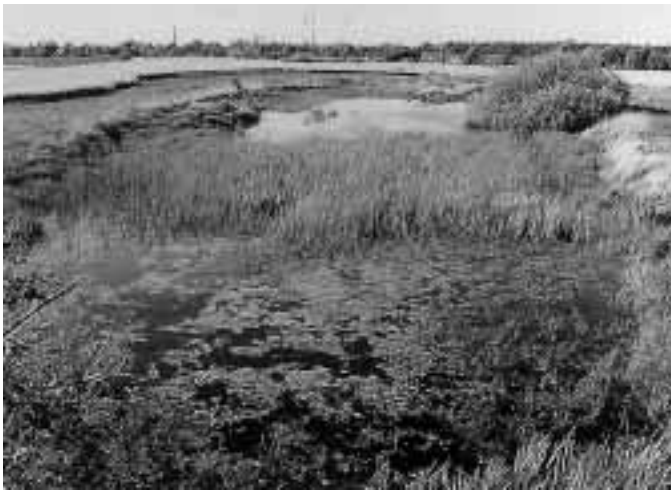
Abb. 2 Offenes Kleingewässer in einer Agrarlandschaft bei Bernau 2a Gesamtansicht